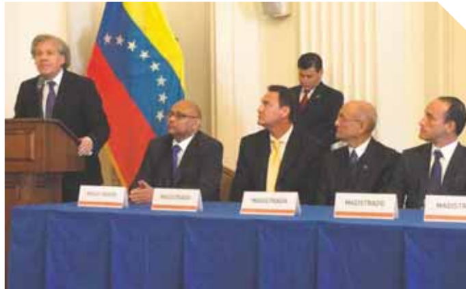
Luis Almagro apoyó al TSJ instalado en la OEA en condición de exilio.

Los 33 magistrados, designados por la AN en sustitu-