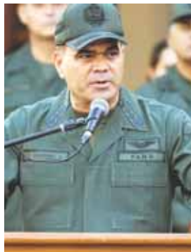
Ministro de la Defensa, Vladimir Padrino López.