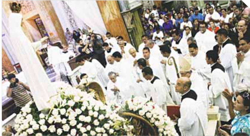
Sacerdotes se entregaron a María en la advocación de la Virgen de Fátima.

Mientras que el Instituto Público Municipal de Salud dispuso de las Clínicas Móviles, para brindar atención a los vecinos en las áreas de medicina familiar, nutrición, pediatría, ginecología, odontología, vacunación y entrega de medicamentos.