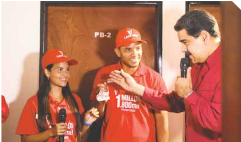
Maduro hizo el anuncio durante la inauguración del complejo habitacional El Gigante Hugo Chávez, en Ciudad Bolívar.

El presidente, Nicolás Maduro, entregó la vivienda número 1 millón 800 mil en Ciudad Bolívar, estado Bolívar, donde además inspeccionó la construcción de hogares de la Gran Misión Vivienda Venezuela (GMVV).