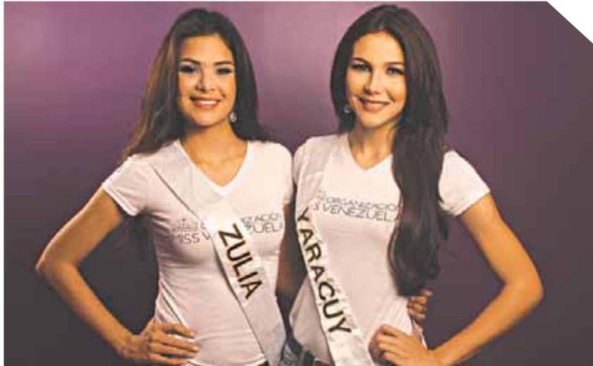
El certamen será el próximo 9 de noviembre.