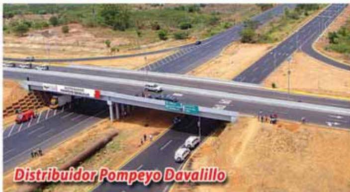
Distribuidor Pompeyo Davalillo

Así completamos 32 Kms. en esta estratégica vía luego de una inversión de Bs. 33 mil 500 millones