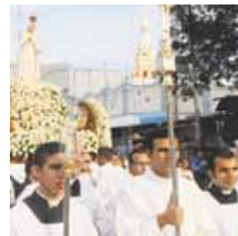
La feligresía caminó junto a Fátima hasta la Basílica.

Por la salvación ante el hambre, la guerra de los pueblos, la discriminación racial y el comunismo pidió el clero marabino en voz de su máximo representante, monseñor Ubaldo Santana.