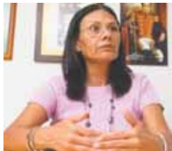
Socorro Hernández, rectora principal del CNE.