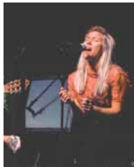
El Lefest se realizó en la Fundación JRP, en San Francisco.