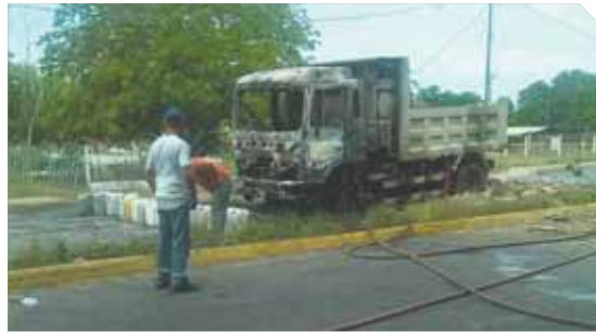
La unidad a la que le prendieron candela durante la intensa manifestación.

Una ama de casa murió arrollada por un camión volteo, durante una protesta por falta de agua, a las 6:30 a. m. de ayer, en la avenida Valmore Rodríguez, sector Punta de Leiva, en Los Puertos de Altigracia, municipio Miranda, Costa Oriental del Lago (COL).