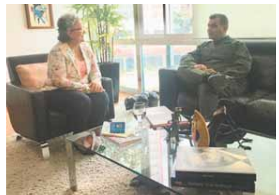
CNE y Ministerio de Defensa coordinan acciones para garantizar la defensa y paz de las elecciones.

Y el general en Jefe Vladimir Padrino López invitó a los venezolanos a participar del acto democrático con la custodia de la Fuerza Armada Nacional Bolivariana este domingo 15 de octubre.