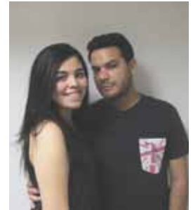
Monotemáticos estrena su tercera temporada.

"Aborda el tema de cómo nos convertimos en enfermos mentales cuando estamos enamorados. Habla de la angustia y del sufrimiento por