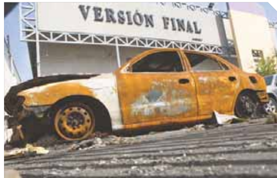
Los vehículos permanecen chamuscados en la sede de Versión Final.

quienes transitan a diario por la avenida Universidad, son testigos de la falta de respuesta de la justicia venezolana. Poco valió la conmoción de los más de 120 empleados, que la tarde de aquel martes, ocupaban sus puestos de trabajo y fueron sorprendidos por una explosión que en menos de 45 minutos consumió con sus llamas a un Hyundai Elantra, un Nissan Sentra, y dos Toyotas: Yaris y Terios. El Ministerio Público no se ha pronunciado sobre los avances de la investigación. Solo un número de expediente, que reposa en los archivos de la Fiscalía Quinta, respalda a las víctimas del ataque. Los propietarios de los vehículos no han sido llamados a rendir declaraciones. Tal parece que ni la utilización de un arma de guerra, de uso exclusivo de la Fuerza Armada Nacional Bolivariana, despertó el interés para dar con los responsables de tan repudiable hecho.