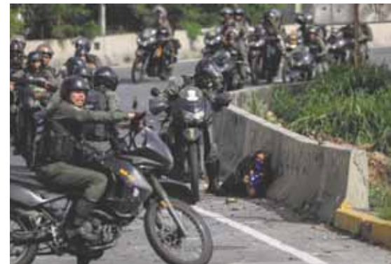
Países miembros de la Unión Europea (UE) están listos para aplicar sanciones selectivas al Gobierno de Venezuela.

Agregó que dichas sanciones se realizarán basadas en informes “presentados por la derecha y corregidos por Estados Unidos como parte del plan imperial para desestabilizar al país”.